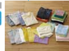
※乾燥後5kgの衣類量の目安