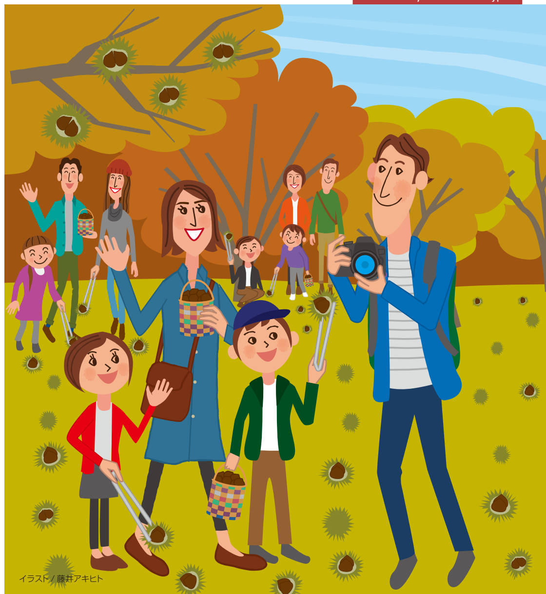
イラスト/藤井アキヒト